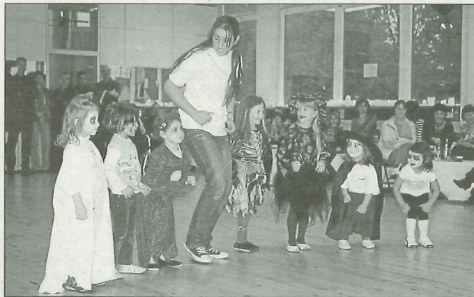
Die Kindertanzgruppe bei ihrer Halloween-Vorführung

shows geben Einblick in die verschiedenen Tanzabteilungen und die Vielfalt der Tanzstile. Kinder und Jugendliche zeigen ihr Können in den Stilen HipHop, Jazz Dance und Ballett. Tänzer/innen aller Altersklassen demonstrieren vielfältige Latein- und Standardtänze, gefolgt von einer Rock'n Roll-Show und einem Line Dance-Workshop, bei dem alle Zuschauer mitmachen können. Das Publikum kann sich darüber hinaus vom erfolgreichen Tanzen der Turnierpaare überzeugen. Die Veranstaltung beginnt um 14:00 Uhr und dauert bis 18:00 Uhr. Weitere Informationen unter www.tanzsport-esslingen.de .