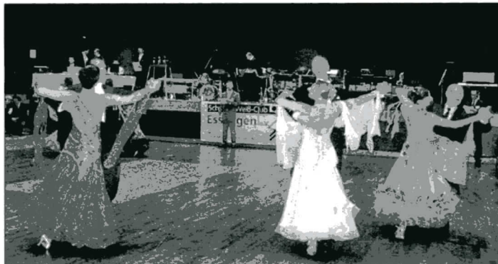
Tanzturnier in der Osterfeldhalle in ES-Berkheim

bis in die 48er und 24er - Runde. Eine schöne Tanzmöglichkeit für Zuschauer besteht bei supertollem Ambiente mit Live-Musik (Orgel) und gutem Parkett im Blackpool-Tower (10 - 17 Uhr). Dort konnte ich umsonst vom Balkon aus den Paaren zusehen. Sie tanzten auch die Gesellschaftstänze (z.B. Mayfair Quick). Für Tanzfreudige kostet der Eintritt 10 Pfund. Es war eine gut gelungene Reise, bei der ich mich gut erholen konnte.“ Die nächste Tanzturnierveranstaltung in Esslingen findet in der Osterfeldhalle in ES-Berkheim am 26.10.2013 statt. Weitere Informationen unter www.tanzsport-esslingen.de